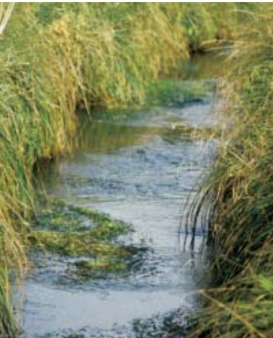
En flot strømrende. Det kan tage tid at nå så vidt, men det betaler sig.

Situationen er en anden i de mange bække og grøfter, der er præget af doven strøm, slam og mudder i bunden og "dårlige" vandplanter som pindsvineknop (se s 12-13). Her må der en målrettet indsats til for at skabe et vandløb, der på længere sigt ikke kræver så megen vedligeholdelse. Løsningen er at forme en strømrende.