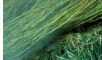
Pindsvineknop kan dække bunden som et tæppe. Den kan styres ved at skære en strømrende.

leen, kan man ramme en balance, så vandløbet selv holder en strømrende fri for grøde, slam og mudder.