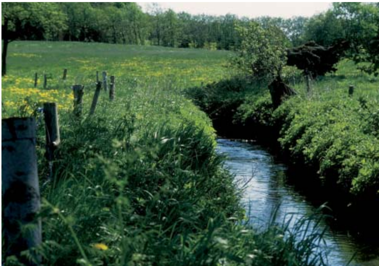
Et vandløb med stabile brinker og gode skjul for fiskene