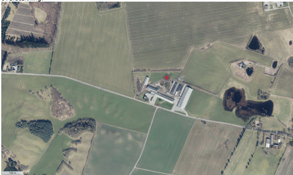
Figur 2. Oversigtskort, der viser ejendommens placering i forhold til naboer. Lyngsøvej 40 ligger i centrum af billedet og gyllebeholderen er vist med en rød plet.

Gyllebeholderen ligger nord for og i tilknytning til ejendommens øvrige bebyggelse. Som det fremgår af Figur 2 så er der ingen nabobeboelser som kan blive generet af indsynet en overdækning.