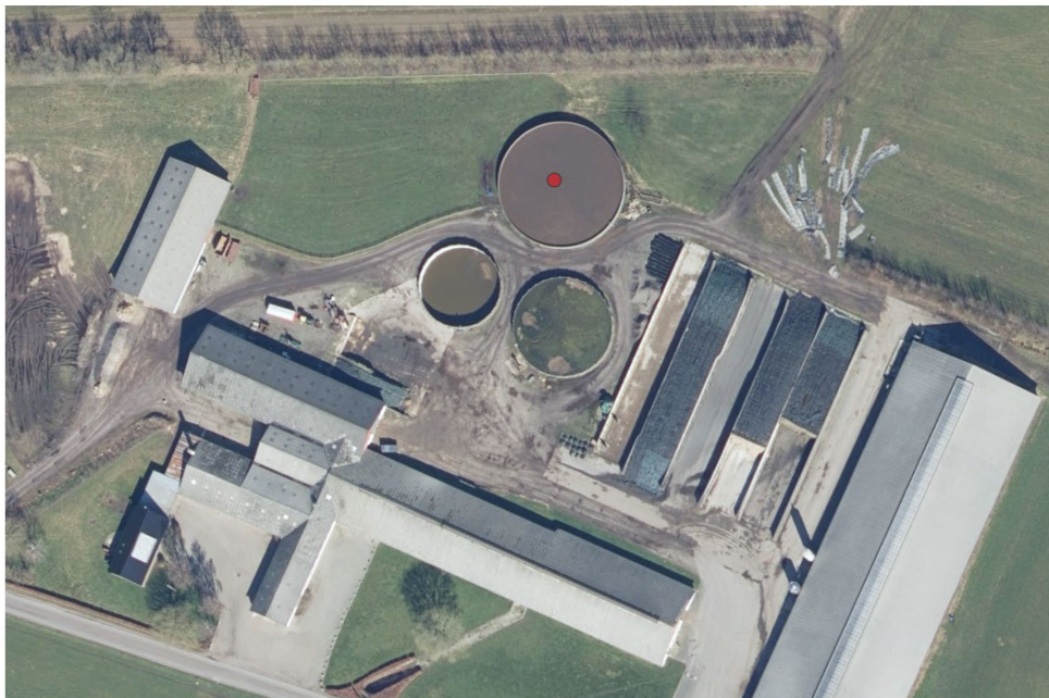
Figur 1. Den røde prik viser gyllebeholderen, som skal overdækkes med telt.

På vegne af Lyngsø Agro v/Søren Henningsen anmeldes hermed teltoverdækning på gyllebeholderen på Lyngsøvej 40, 9240 Nibe. Beholderen er vist på Figur 1.